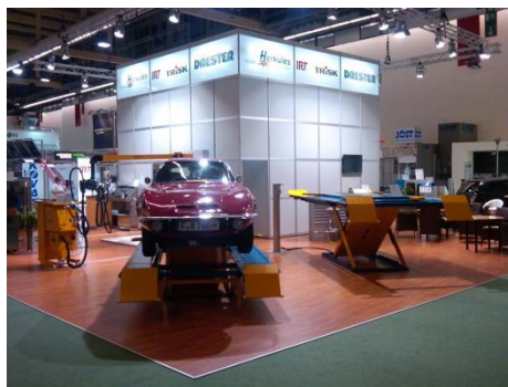
Automechanika-mässan, Frankfurt, Tyskland, sept.2010